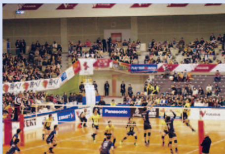
Vプレミアリーグ北九州大会

北九州市バレーボール協会は、小学生連盟・ママさん連盟・ソフトバレーボール連盟・中学校体育連盟・高等学校体育連盟等、多くの団体で構成されています。