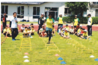
「ジュニア陸上スポーツ教室」