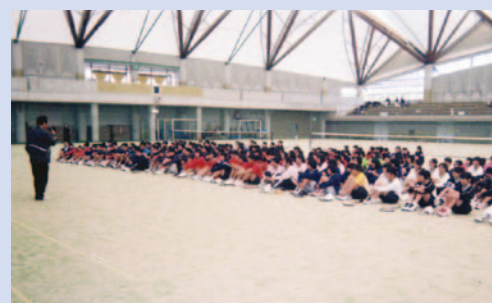
ジュニア競技力向上講習会 開講式

1886年、日本で軟式庭球が誕生。軟式庭球は年々盛んになり、太平洋戦争時、一時中断したが昭和21年第1回の全日本選手権（天皇杯皇后杯大会）が開催され、一躍人気競技となった。昭和30年代八幡製鐵、住金小倉、東陶等の選手が全日本選手権、全日本実業団、国体、インター杯大会で優勝し日本でも注目の市であった。平成に入り企業が運動部の活動を縮小、現在は往年の選手がシニアクラスとなり各個人個人が活動しているのが現状である。そこで、市連盟として、今後ソフトテニスの愛好者を増やすため小学生、中学生の指導を重点的に活動すると共に、ひいてはシニアクラスの人にとって、それが末永い健康長寿につながることから頑張っていく所存です。そのために日頃より特段のご協力を賜っている（公財）北九州市体育協会に心より厚く御礼と感謝を申し上げます。