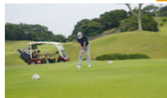
(九州ゴルフ倶楽部八幡コース)