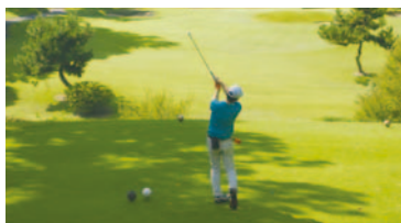
(小倉カンツリー倶楽部)