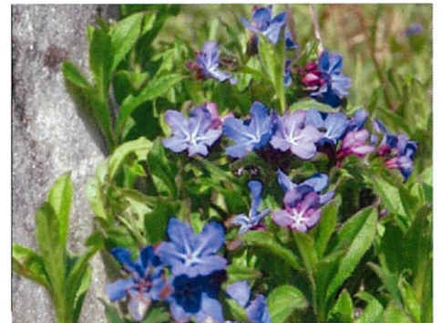
△ホタルカズラ ▽シラン

※北九州市内居住以外の方もご参加いただけます。時刻までに行く便のない方はご相談ください。